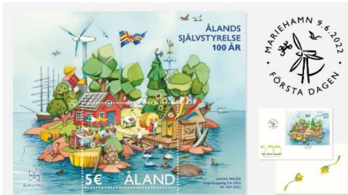
Briefmarke der Åland Post zur Feier des 100-jährigen Bestehens der åländischen Autonomie.