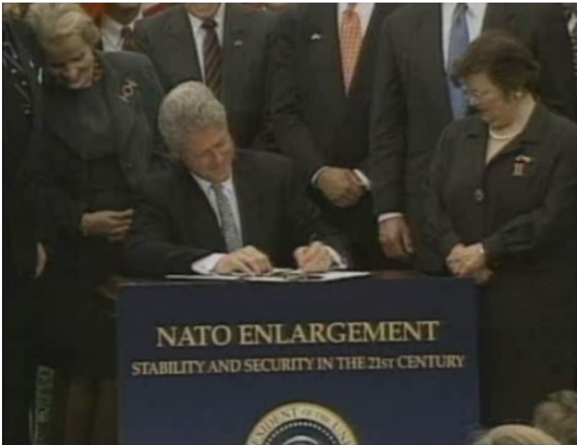
President Bill Clinton signs NATO enlargement legislation, May 21, 1995