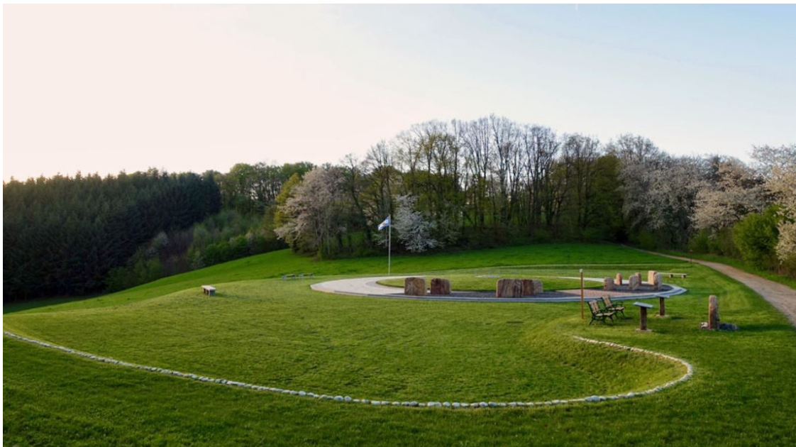
In einem Garten der Freiheit