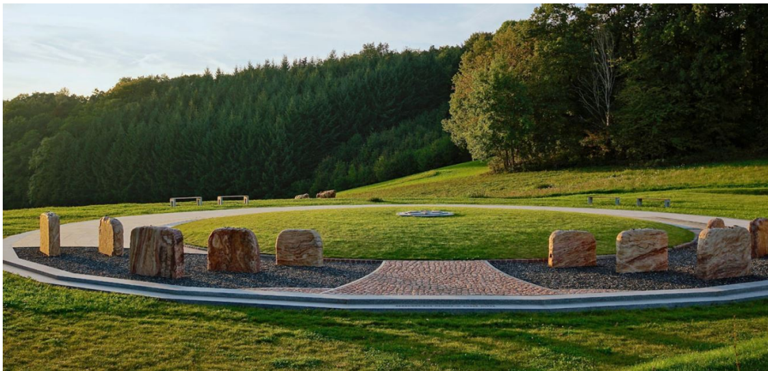
Deutschland als Friedensnation, Foto: friedensmal.de ( https://friedensmal.de/philosophie/deutschland/ )