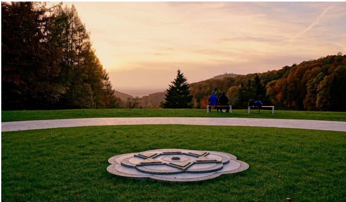
Blick in die Rheinebene, Foto: friedensmal.de ( https://friedensmal.de/ort/schum/ )