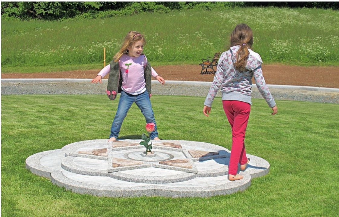
„Die Blüte des Schalom“ als Symbol des Herzens, Foto: friedensmal.de ( https://friedensmal.de/ )