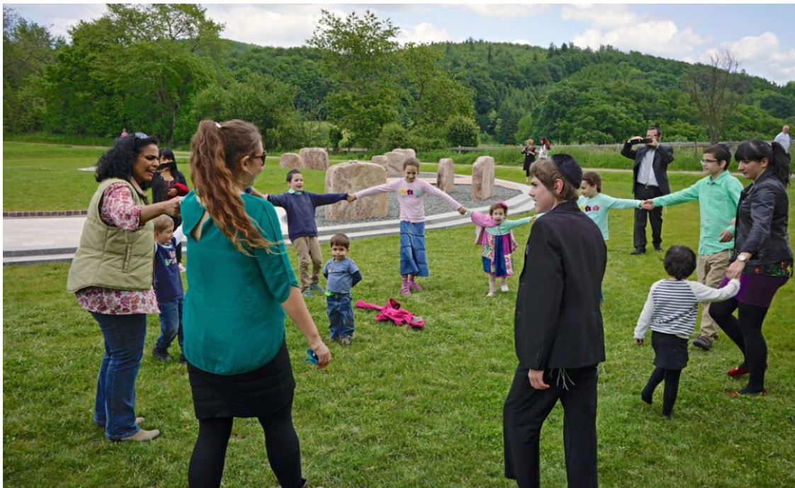
Das Fest „Lag baOmer“ am Friedensmal