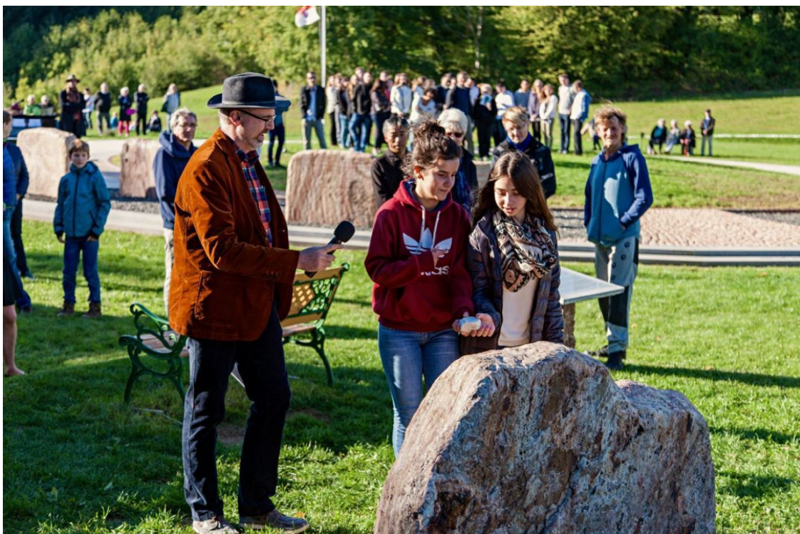
Einweihung des Jerusalem Friedensmals, Foto: friedensmal.de ( https://friedensmal.de/entwicklung/einweihung/ )