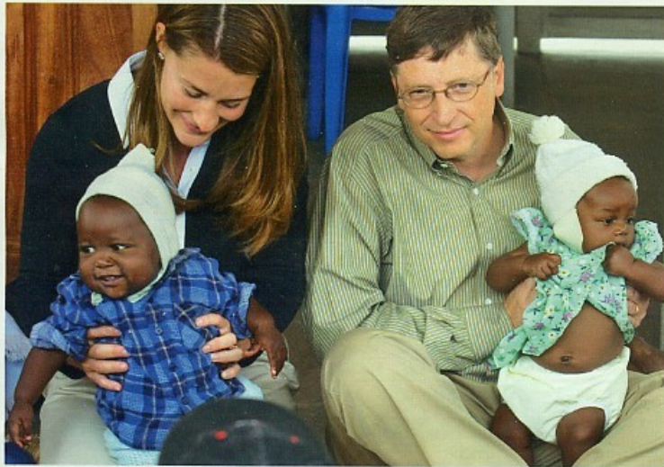
Stifter Gates, Ehefrau Melinda*: „Ich genieße es zu helfen“