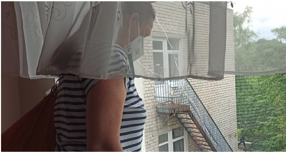
Kindergarten Rosinka, Einschussloch im Fenster