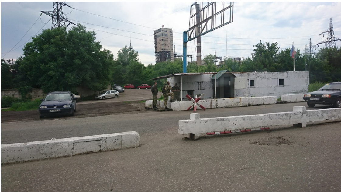
Lugansk, Blockposten Stadtausfahrt