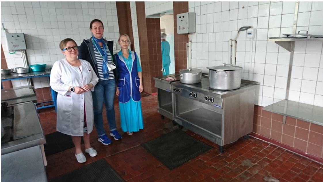
Brjanka Krankenhaus, Lugansk, Küchenteile des Aktionsbündnis Zukunft Donbass