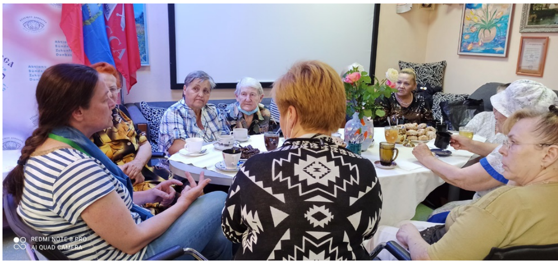
Lugansk, Treffen mit Rentnern; Foto: Iwana Steinigk