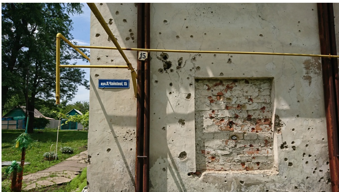
LNR, Juni21, Solotoe-5; Foto: Iwana Steinigk