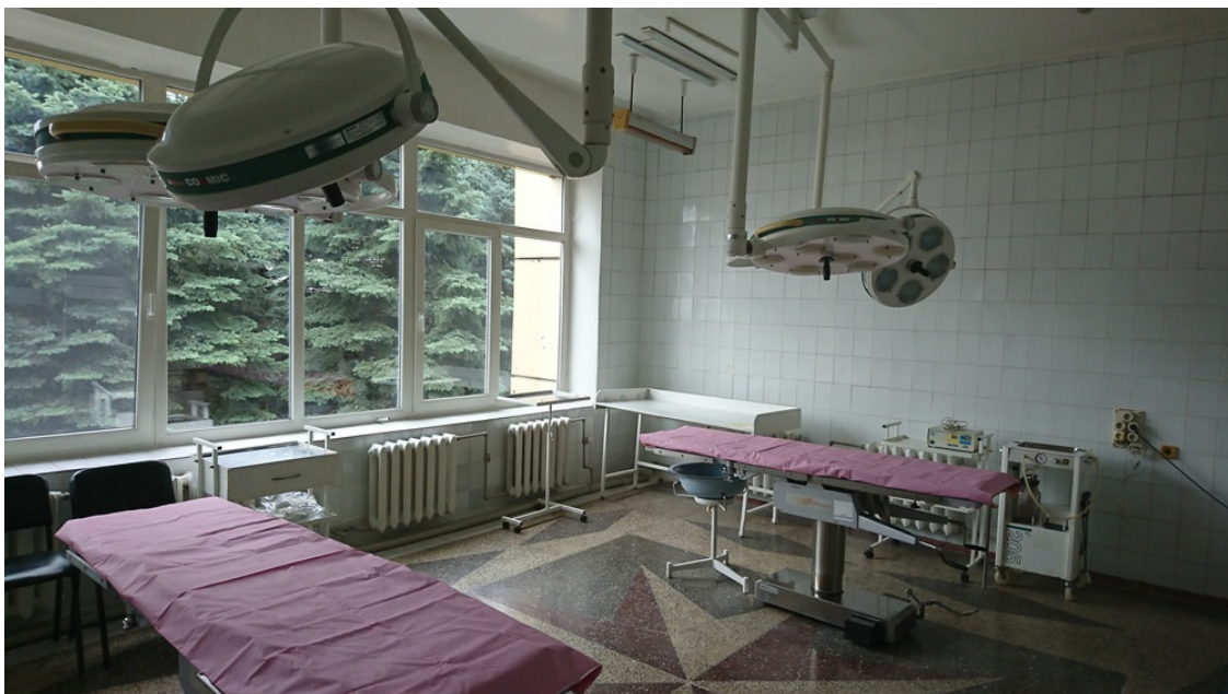
Kinderkrankenhaus OP-Saal; Foto: Iwana Steinigk