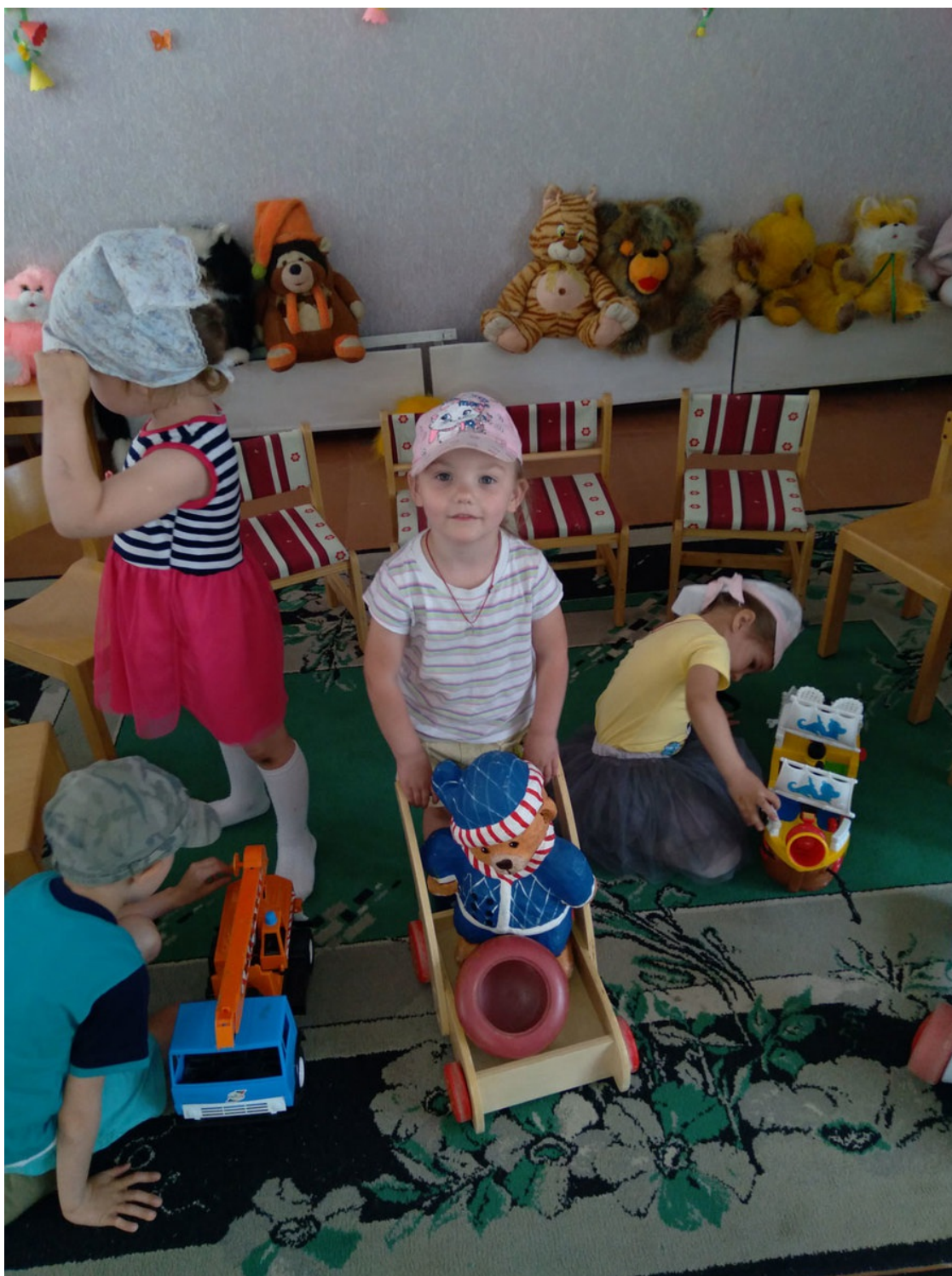
Kindergarten Rosinka