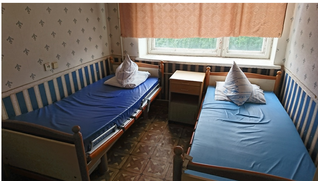
ZHD Krankenhaus für Notfallmedizin, alte Betten; Foto: Iwana Steinigk