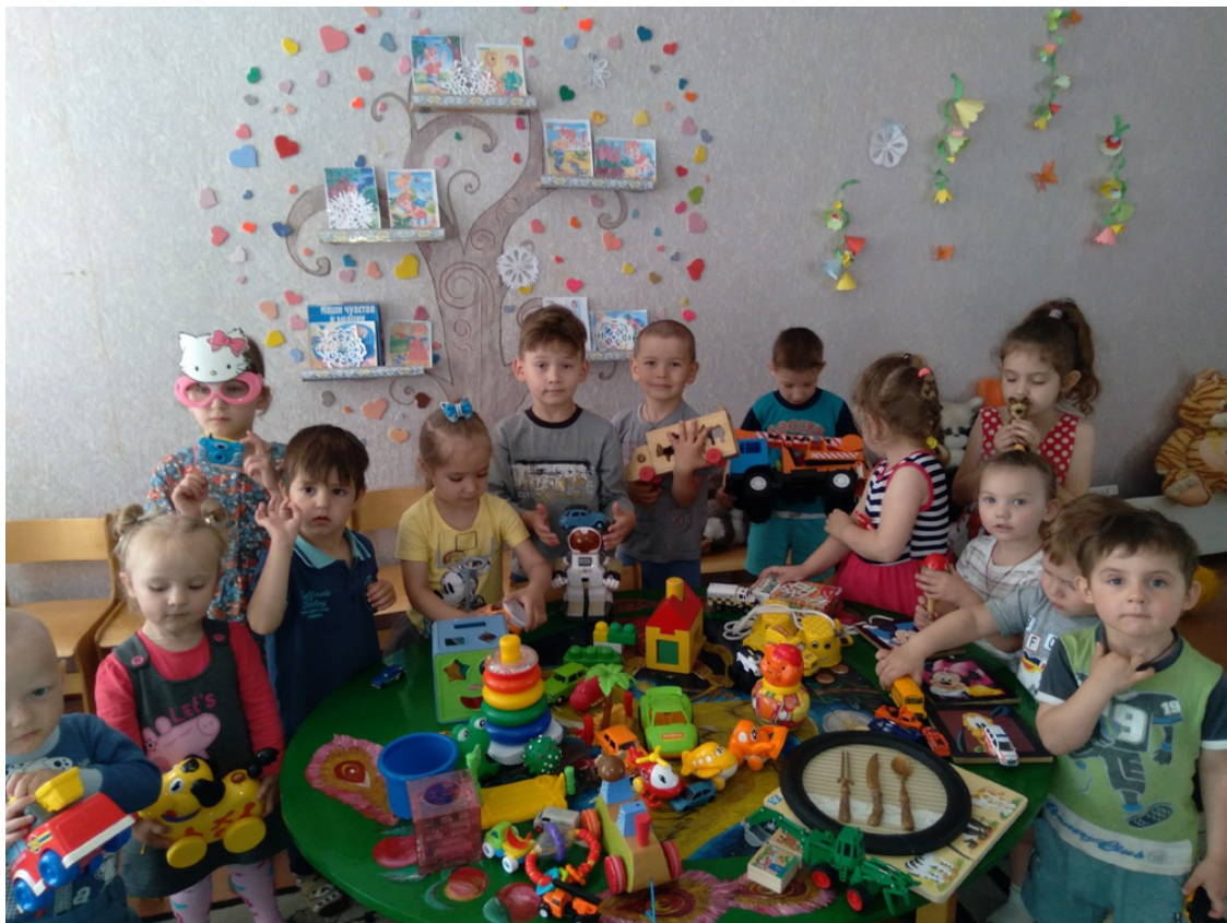
Kindergarten Rosinka; Foto: Iwana Steinigk