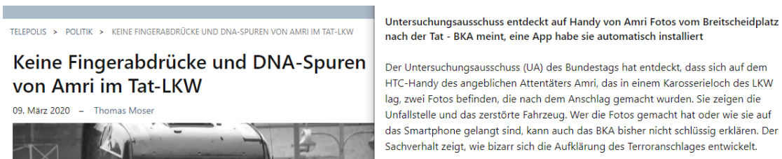
Bild 3: Berichterstattung zum Amri-Untersuchungsausschuss bei Telepolis.

Kritiker merken nun an, dass Anfang März 2020 im Breitscheidplatz-Untersuchungsausschuss des Deutschen Bundestages bekannt wurde, dass im bei der Tat benutzten und angeblich von Anis Amri gefahrenen LKW im Führerhaus keine DNA-Spuren oder gar Fingerabdrücke von Amri gefunden wurden und dass nicht einmal auf seiner Brieftasche und seinem Handy solche gefunden wurden (6). Das sei natürlich ein Ding der Unmöglichkeit, sollte Amri tatsächlich den Anschlag begangen haben. Er könne den Anschlag nicht begangen haben. Darauf würden auch Erkenntnisse des Bundestagsuntersuchungsausschusses vom Mai 2020 hindeuten, nach denen Fotos des Breitscheidplatzes nach dem Anschlag auf dem Handy des erschossenen Attentäters Amri entdeckt wurden (7, 8). Dass „eine App“ diese Bilder nachträglich automatisch installiert habe, wie das BKA mitteilt, sei unmöglich.