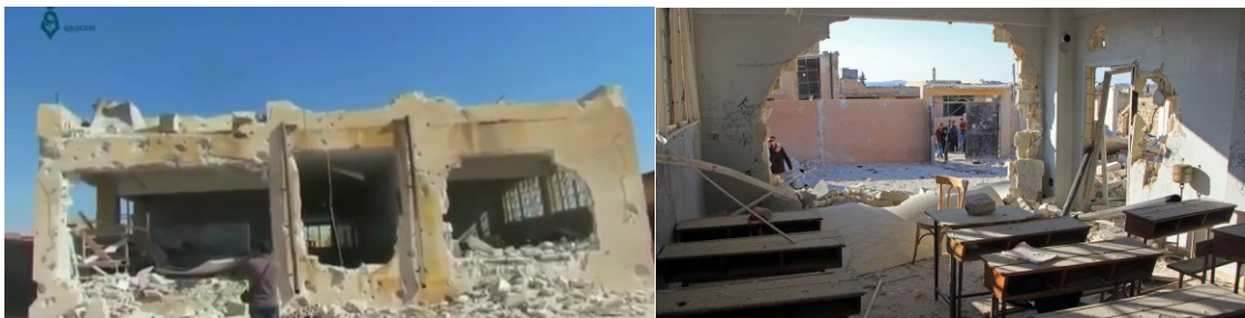
Bild 2: Angeblich durch Bombenangriff zerstörte Schule (Screenshots von Youtube).

Eine Schule im syrischen Ort Hass/Haas – Region Idlib – soll im Oktober 2016 bei einem Luftangriff zerstört worden sein. Kritiker bemängelten, dass keine Luftraumüberwachungsdaten als Beleg für die Anwesenheit von Flugzeugen zur fraglichen Zeit am fraglichen Ort vorgelegt wurden, dass ein Video, welches das angreifende Flugzeug zeigen soll, erkennbar aus mehreren Videos von unterschiedlichen Zeitpunkten zusammengestückelt worden sei und dass die gezeigten Schäden nicht durch eine im Hof explodierte Fliegerbombe verursacht worden sein können (5). Im Klassenzimmer sei direkt hinter der Mauer abgelagerter Sand zu sehen. Die Tische und Bänke seien intakt und man sehe ungestörten feinen Sand auf den Tischen, aber keine im Raum verstreuten Mauertrümmer.