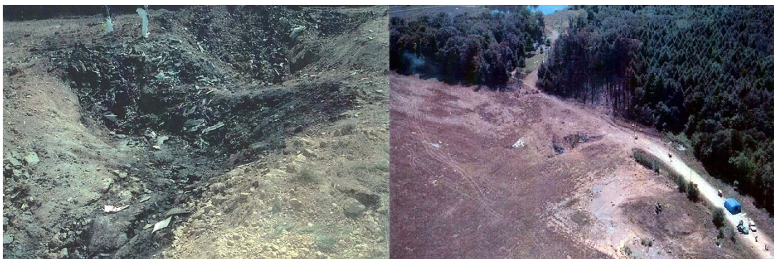
Bild 4: Absturzstelle von Flug 93 in Shanksville, Pennsylvania, 11. September 2001. Der links in Großaufnahme zu sehende Krater ist im rechten Foto genau in der Mitte zu sehen. Die Fotos wurden von US-Behörden hergestellt und sind Public Domain (9, 10).

Warum soll man den Absturz des Boeing-757-Verkehrsflugzeuges bei 9/11 in Shanksville, USA — United-Airlines-Flug 93 — nicht hinterfragen dürfen? Das fragen sich zahlreiche Menschen, denen die promovierte Physikerin Angela Merkel attestiert, nicht ganz dicht zu sein. Die unten gezeigten Fotos wurden von US-Behörden veröffentlicht. Es handelt sich dabei ganz offiziell um die Absturzstelle dieses Passagierflugzeuges auf einem Feld bei Shanksville bei den Terrorattacken vom 11. September 2001, bei dem alle 44 Insassen ums Leben gekommen sein sollen.