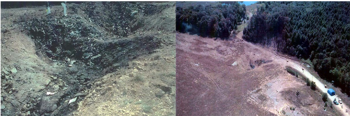
Bild 4: Absturzstelle von Flug 93 in Shanksville, Pennsylvania, 11. September 2001. Der links in Großaufnahme zu sehende Krater ist im rechten Foto genau in der Mitte zu sehen. Die Fotos wurden von US-Behörden hergestellt und sind Public Domain (9, 10).

Warum soll man den Absturz des Boeing-757-Verkehrsflugzeuges bei 9/11 in Shanksville, USA – United-Airlines-Flug 93 – nicht hinterfragen dürfen? Das fragen sich zahlreiche Menschen, denen die promovierte Physikerin Angela Merkel attestiert, nicht ganz dicht zu sein. Die unten gezeigten Fotos wurden von US-Behörden veröffentlicht. Es handelt sich dabei ganz offiziell um die Absturzstelle dieses Passagierflugzeuges auf einem Feld bei Shanksville bei den Terrorattacken vom 11. September 2001, bei dem alle 44 Insassen ums Leben gekommen sein sollen.