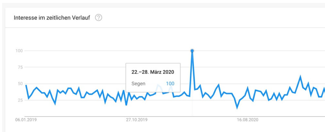
Bild: Wenig verwunderlich, erfährt der Begriff Segen in der 2. Märzhälfte 2020 einen Häufigkeitspeak, der höchste kirchliche Feiertage in den Schatten stellt. Nicht nur der Papst erteilt seinen Segen, auch das restliche Bodenpersonal segnet eifrig, und die ersten Klimaretter sinnieren, inwiefern ein Lockdown zu einem Segen umzudeuten sei.

Diese Feinde konstituieren die „antifaschistische“ In-Group und Glaubensgemeinschaft. Sie gefährden durch ihr Abwechlerum „uns“ und unser heiliges Ziel – den Schutz von Menschenleben – noch mehr als das Virus. In ihrer ersten Ansprache stellt Merkel so die Weichen für das künftige Geschehen, erteilt quasi ihren Segen für die Inquisition 2.0 und macht deutlich, welche Tonalität und Totalität das Geschehen untermalen wird.