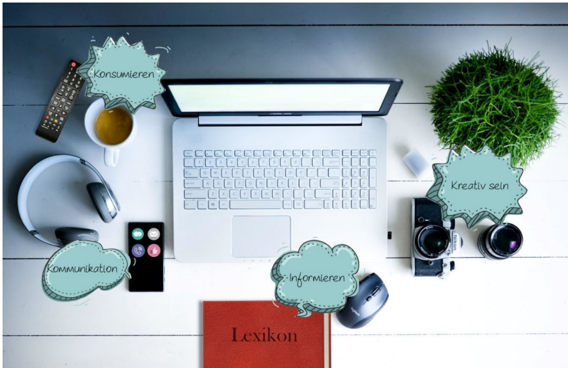
Bild 2: Vorschlag für den Startbildschirm der öffentlich-rechtlichen Medien-Plattform auf PC, Handy oder Smart-TV

kennen, indem sie nur einen kleinen Ausschnitt der Möglichkeiten nutzen. Der Startbildschirm der Plattform könnte für Nutzer von PC, Handy oder Smart-TV, also Geräten mit Rückkanal, zum Beispiel wie in Bild 2 gezeigt aussehen.