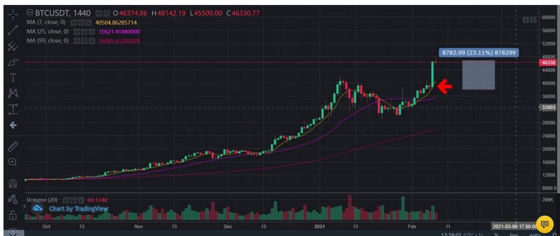
Abbildung 1.

erhalten zu haben. Als kritischer Beobachter des Zeitgeschehens kann man dies nur noch mit einem müden Lächeln quittieren. Wer wirklich einen raketenhaften Anstieg beobachten möchte, der schaue sich einfach den Anstieg des Bitcoin-Kurses https://cointelegraph.com/bitcoin-price-index vom 8. Februar an.