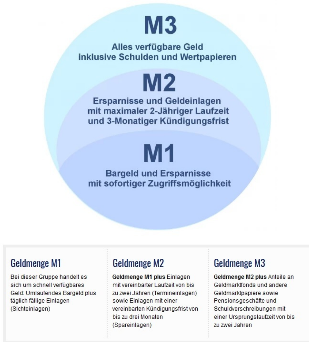
Abbildung 3: Definition der Geldmengen M1, M2, M3

Das Platzen der Blase im aktuellen Geldsystem und die toxische Verschuldung der Welt ( https://www.rubikon.news/artikel/der-verschuldete-planet ) wird mit den herkömmlichen Mitteln der Finanzpolitik nicht mehr aufzuhalten sein. Alle Indikatoren deuten darauf hin, dass wir uns auf tiefgreifende Veränderungen einstellen müssen. Ein Reset scheint unausweichlich. Doch die führenden Zentralbanken und tonangebenden Staaten der Welt arbeiten bereits unter anderem im Verbund mit der Better Than Cash Alliance und der Great Reset -Avantgarde daran, das Bargeld endgültig abzuschaffen und die Währungen zu digitalisieren ( https://norberthaering.de/kryptowaehrungen/digitaler-euro/ ). Dies bedarf einer globalen Neustrukturierung des Bankenwesens.