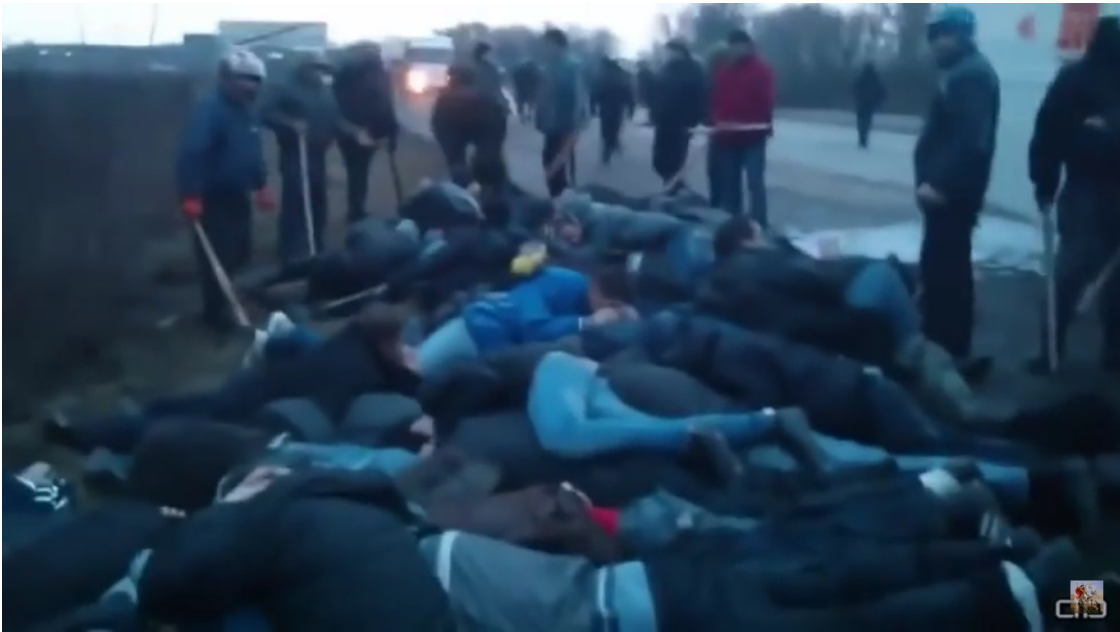
Bild 4: Bei Korsun-Shevshenko südlich von Kiew erniedrigten und verprügelten Maidananhänger Dutzende Menschen, die auf dem Rückweg von Anti-Maidan-Protesten waren (Quelle: Screenshot von YouTube, Video inzwischen gelöscht).

Trotz mehrfacher Anfragen konnten die Berliner Pressesprecher von Amnesty International weder bestätigen noch dementieren, ob ihre Organisation etwas über den Vorfall weiß. Stattdessen gab es ausweichende Antworten. Das Berliner Büro von „Human Rights Watch“ reagierte gar nicht erst auf die Presseanfrage.