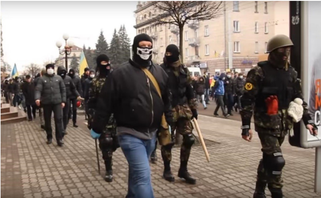
Bild 2: Vermummte Bewaffnete mit Nazi-Symbolik wie der Wolfsangel, am Oberarm des Kämpfers rechts im Bild, marschieren am 19. Februar 2014 durch das westukrainische Luzk; anschließend verprügelten sie den dortigen Gouverneur und zwangen ihn zum Rücktritt.