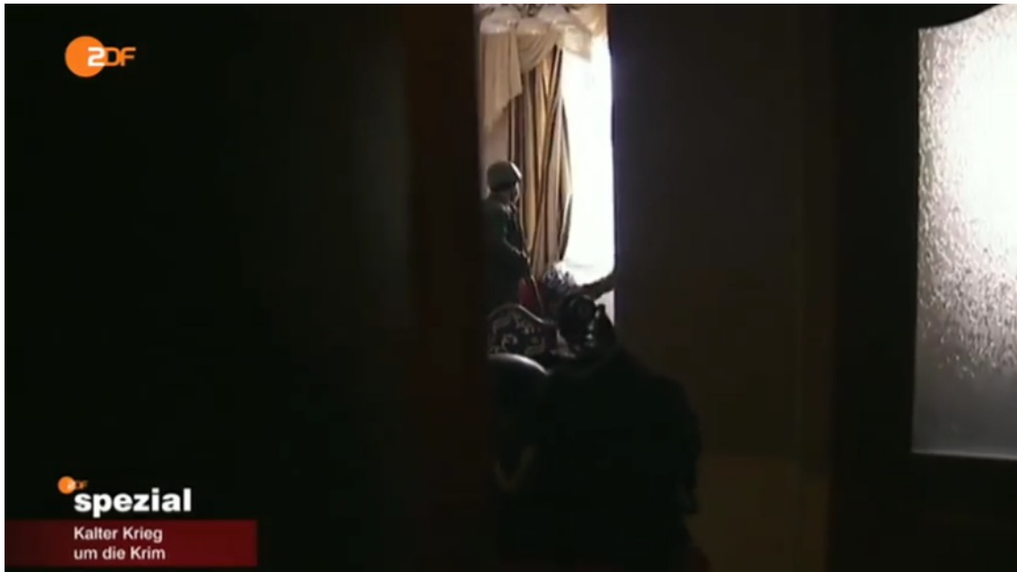
Bild 3: Bewaffnete Maidankämpfer feuerten am 20. Februar 2014 aus einem ZDF-Zimmer des Hotel Ukraina in Richtung der Todeszone. Erst zwei Wochen später zeigte der Sender kurz Bilder davon in einem ZDF-Spezial zum Thema Krimkrise (Quelle: Screenshot von Facebook

( https://www.facebook.com/ivan.katchanovski/videos/vb.100000596862745/989716864391533 )