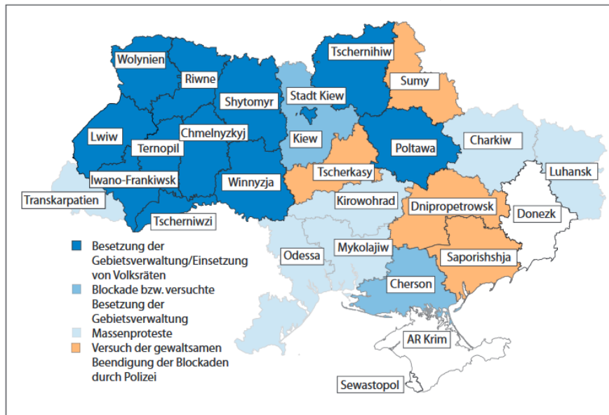
Grafik 1: Stand der Protestaktionen in der Ukraine am 27.01.2014, 14:00 Uhr

Quelle der Daten: Infografik von inspired, < http://inspired.com.ua/news/curomaidan-map/ >